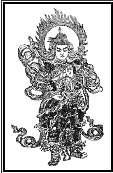
Nam Mô Hộ Pháp Vi Đà Tôn Thiên Bồ Tát