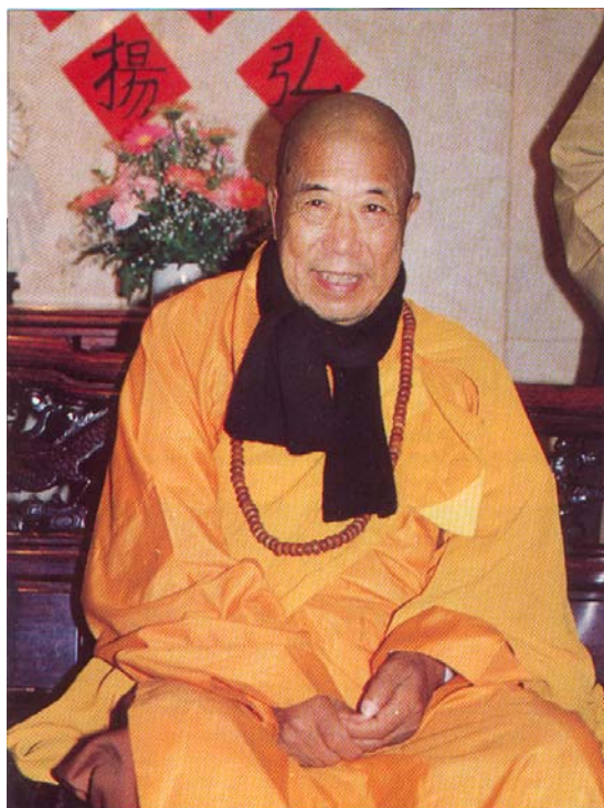
HOÀ THƯỢNG TUYÊN HOÁ