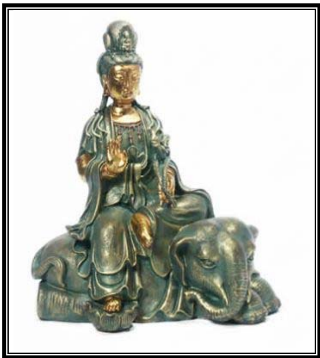
NAM MÔ ĐẠI HẠNH PHỔ HIỀN BỒ TÁT