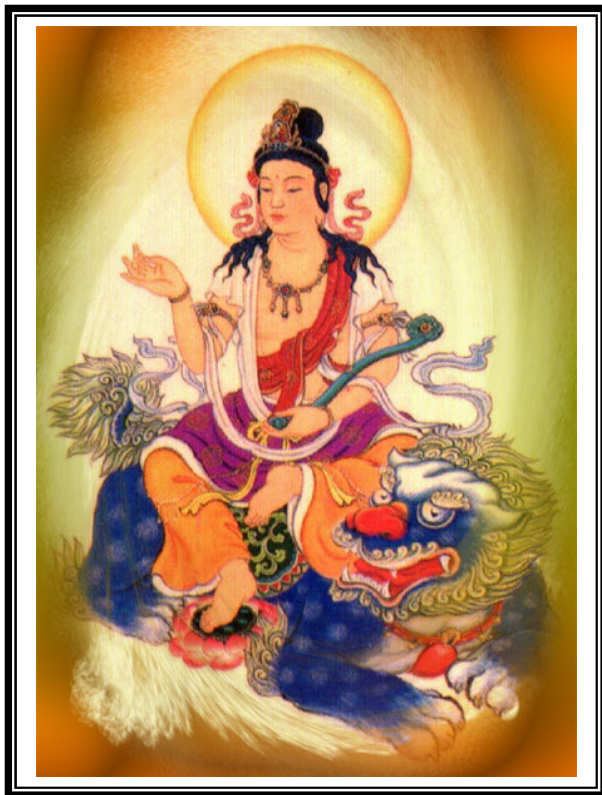
NAM MÔ ĐẠI TRÍ VẤN THÙ SỰ LỢI BỒ TÁT