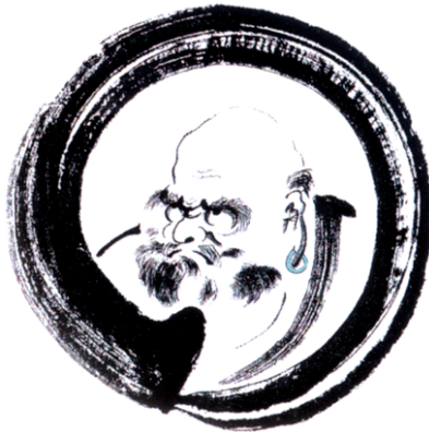
A Selection of Mahayana Art by Brian Barry

Bồ Tát thành tựu được mười thứ pháp nhẫn này, đó là trí huệ và công đức tu hành của Ngài mà thành tựu. Phàm phu chúng sinh chẳng cách chi có thể dò lường được.